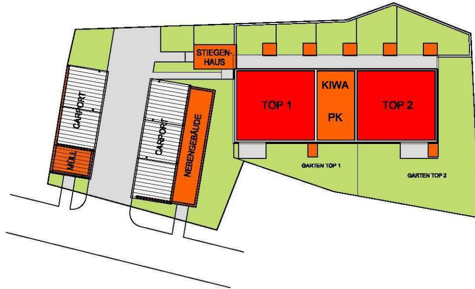
LAGEPLAN / WOHNUNGSANORDNUNG ERDGESCHOSS