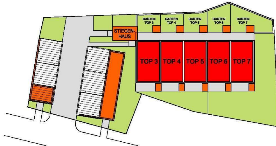
WOHNUNGSANORDNUNG OG / DG